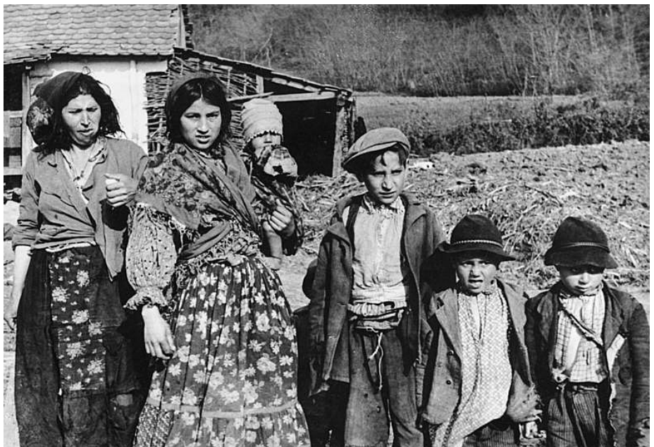
Erromaniek Europako gutxiengo etniko handiena osatzen dute. DEUTSCHES BUNDESARCHIV.

Ba ote dago argitxerik dokumentatu gabeko gizatalde baten iragana? Eta historia bera baino mila-ka urte lehenago gertatutako giza migrazioen berri jakiterik? Horrelako galderari erantzuteko tresna paregabea da genetika. Iraultza teknologikoari esker, gaur egun posible da genoma bat erdiestea 100 euroan, sakon (genotipatze teknikaz), eta 5.000 euroan guztiz (sekuentziatuz). Mundu osoan zehar hartutako gizakien genomak aztertuta, gure espeziearen sorreratik (duela 200.000 urte) izandako giza migrazioak ezagutu ahal izan ditugu. Besteak beste, Homo sapiens Afrikako